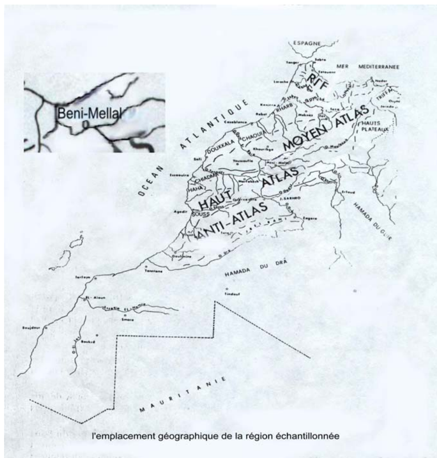
Figure 1. La carte du Maroc et la position de la région de Beni Mellal.

Pour le degré de signification du test \chi^2 : P>0.05 : une différence non significative (NS) P<0.05 : une différence significative (*) P<0.01 : une différence hautement significative (**) P<0.001 : une différence très hautement significative (***)