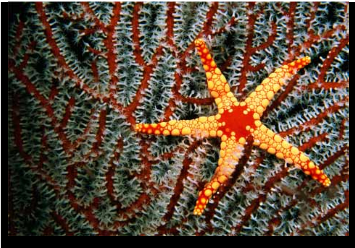
Etoile De Mer, Iles Maldives